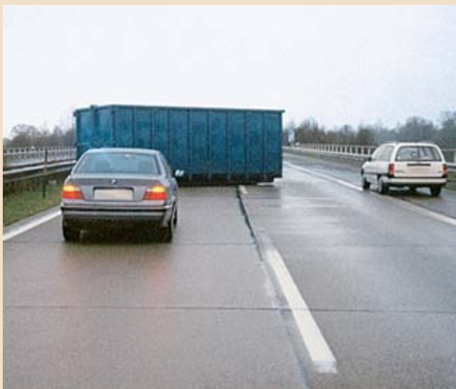
▲ Während der Fahrt fiel dieser Abrollbehälter von der Lade- fläche.

Es gibt neue Trägerfahrzeuge, deren Tragmittel und Hebezeuge so eingestellt werden können, dass diese die Absetzmulde nach hinten ausreichend sichern. Diese Fahrzeuge sind aber noch recht selten. In den meisten Fällen reicht das Hebezeug zur rückwärtigen Sicherung nicht aus und es