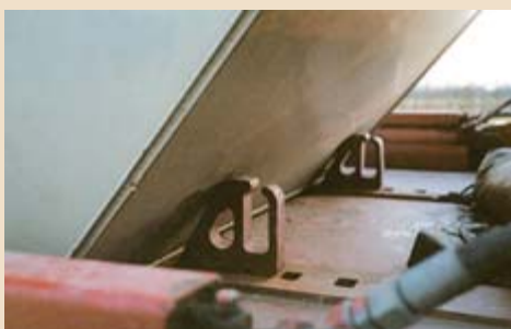
◀ Formschlüssige Sicherung eines Absetzbehälters in Fahrtrichtung.