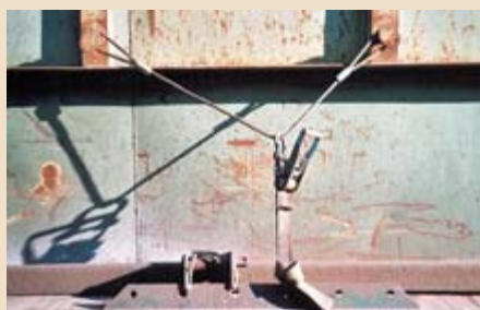
► Eine Y-Zurrung ist Niederzurren. Diese Sicherungsart ist für schwere Absetzmulden nicht ausreichend.