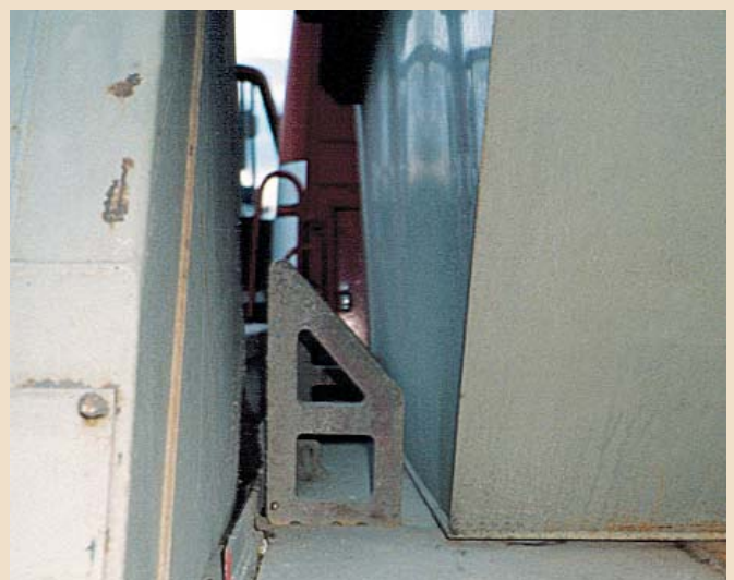
▲ Formschlüssige Sicherung eines Absetzbehälters zur Seite. Der Abstand zur Halteeinrichtung ist nur gering und kann akzeptiert werden.