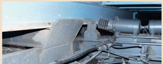
▲ Blick unter einen Abrollbehälter, der durch Halteeinrichtung ausreichend gesichert wird.