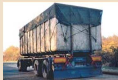
◀ Das Abdecken mit einer Plane ist hier als Ladungssicherung für die im Container befindliche Ladung völlig ausreichend.