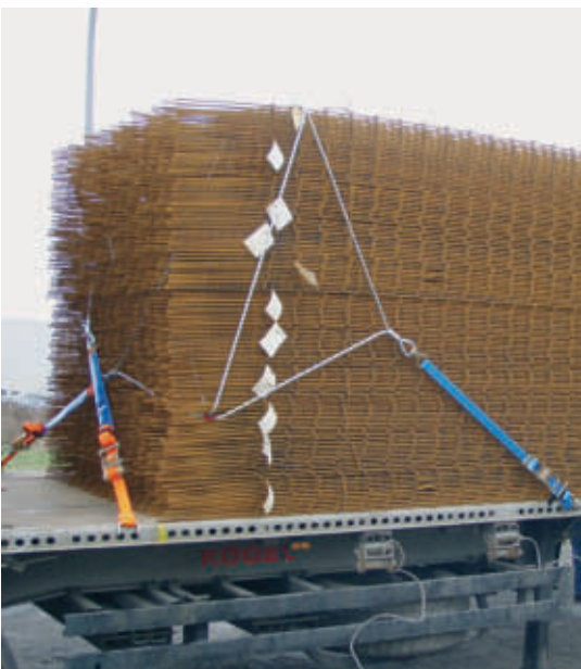
Position der Seilschlingen