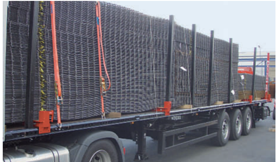
Seitliche Sicherung durch Rungen und Zurrgurte

ressanten Sattelanhänger, der speziell für Betonstahlmattentransporte konzipiert ist.