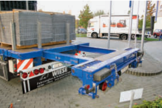
Formschluss nach hinten