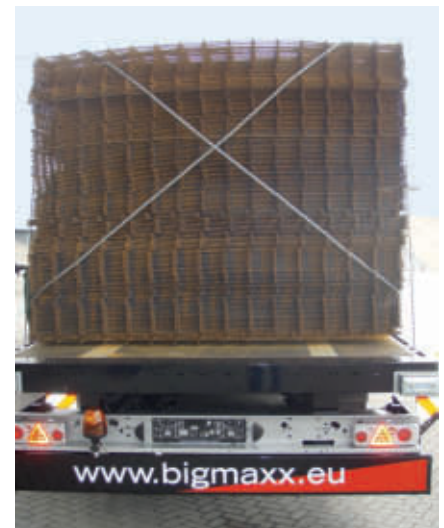
Rückwärtige Sicherung durch Rungen und Zurrdrahtseile

Es handelt sich dabei um einen verlängerten und verstärkten Plattform-sattelauflieger mit einer nutzbaren Ladelänge von 15 m. Neben dem sicheren Verladen der aktuellen und zukünftigen Betonstahlerzeugnisse wird die aktive Sicherheit durch die Verringerung der Ladehöhe und damit der Reduzierung des Lastschwerpunktes erhöht. Durch das Entfallen der über-