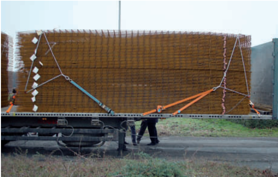
Sicherung durch spezielle Zurrdrahtseilsysteme

gen ist bis 2.380 mm möglich. Das System verfügt über reibwerterhöhende Querbalken und das Fahrzeug kann von der Seite mit einem Stapler beladen werden.