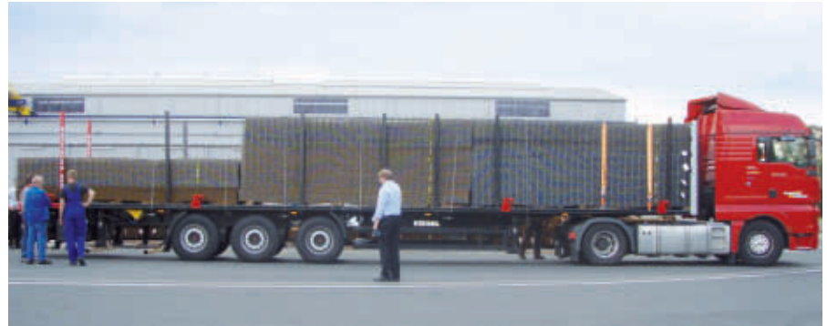
Kögel Big-MAXX steel