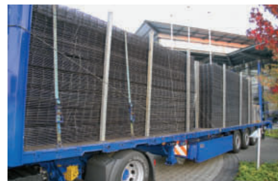
Formschluss zur Seite

Formschluss ist die beste Ladungssicherung, diese Grundweisheit gilt für alle Ladegüter, auch für Betonstahlmatten!