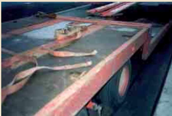
Die Fliehkkräfte waren so groß, dass die Zurrgurte rissen.