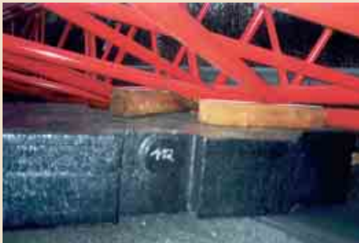
◀ Eine große Reibungskraft hilft bei der Ladungssicherung.

Beim Rutschen der Ladung wurden die Zurrgurte, die in der Überspannung als Niederzurrgurte angebracht waren, überlastet. Um dies auszuschließen