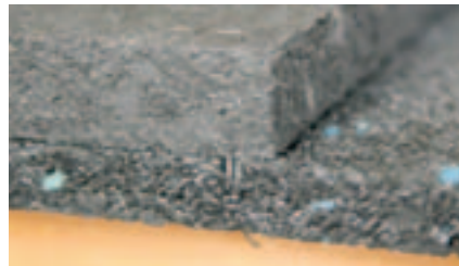
Die Schwerlastmatte (oben) hat im Gegensatz zur unteren Matte keinen Hohlraumanteil.