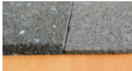
Matten gibt es, je nach Einsatzzweck, in unterschiedlichen Stärken.

mit einem großen Hohlraumanteil zwischen den einzelnen Granulatfasern werden bei hohem Druck seifig und rutschig, während die wesentlich massivere Schwerlastmatte diesem Druck schadlos standhält.