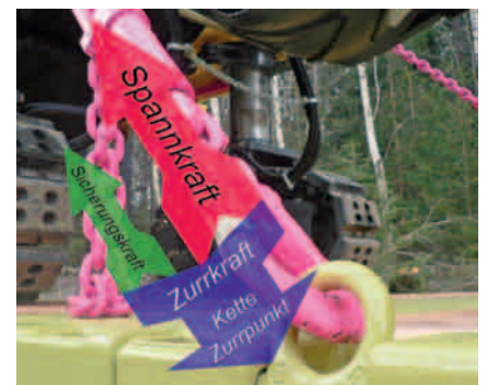
Die Spannung ist zu hoch, sie raubt der Kette und dem Zurrpunkt zu viel Kraft.

Beim Direktzurren soll die Kette die Ladung nicht ziehen, sondern sie soll sie an ihrem Platz halten, und zwar erst dann, wenn sie in Extremsituationen rutschen oder kippen will. Es ist sogar sehr nachteilig, wenn die Kette zu stramm vorgespannt wird, denn je mehr Kraft ich der Kette – und gleichzeitig auch dem Zurrpunkt – durch eine hohe Vorspannung nehme, desto weniger Kraft bleibt ihnen, um die Ladung dann zu halten, wenn es tatsächlich darauf ankommt. In der Praxis sollte die Kette handfest gespannt werden, das bedeutet, dass sie nicht mehr durchhängt aber auch noch keine „Musik macht“.