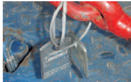
Zurrkette mit zwei Kennzeichnungsanhängern

Es empfiehlt sich, an der Zurrkette einen zweiten Kennzeichnungsanhänger anzubringen, auf dem die jährliche Prüfung vermerkt ist.