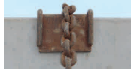
Der Kantenschützer aus Metall schont die Kette und die Ladung.

liegt laut Herstellerangaben im Bereich von 1.500 daN bis 4.200 daN im direkten Zug. Aber Achtung, die Ladung und vor allem die Zurrpunkte am Fahrzeug müssen diese Kraft auch aufnehmen können.