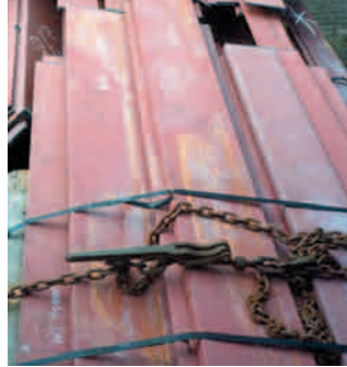
Diese Spannelemente sind gefährlich und dürfen nicht verwendet werden.

Beispiel: Die Kette hat eine Zurzkraft (LC) von 10 kn (10 t), der Zurzpunkt ist mit der Zahl 5 gekennzeichnet und kann daher ebenfalls mit 10 t belastet werden. Der Fahrer spannt die Kette so stark an, wie er kann und erreicht dabei eine Spannkraft von 6.000 daN (6 t). Jetzt bleibt dem System Kette – Zurzpunkt nur noch eine „restliche“ Sicherungskraft von 4 kn (4 t) für ihre ei-